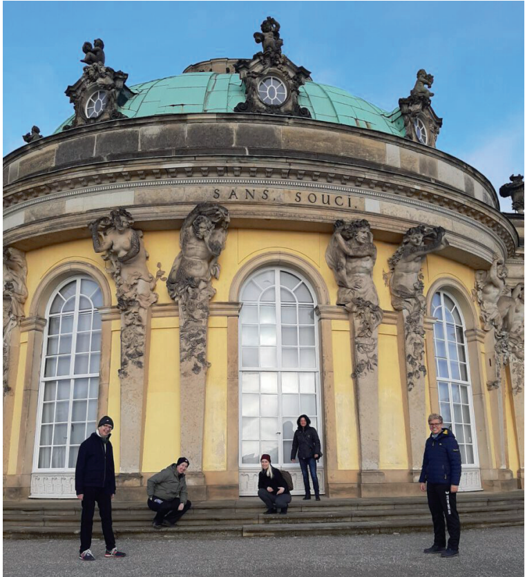
1. Damen □ sorglos □ vor Schloss Sanssouci und dem Spiel gegen Standsdorf

Während der Spielbetrieb in Hamburg aktuell unterbrochen ist, wird in der Oberliga regulär weitergespielt. So stand für die 1. Damenmannschaft gleich am zweiten Januarwochenende der Auswärtstrip zum Tabellenschlusslicht TSV Standsdorf auf der Agenda.